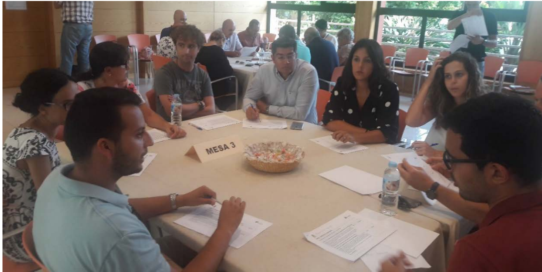
Figura 8. Componentes de la Mesa 3 (2ª jornada).