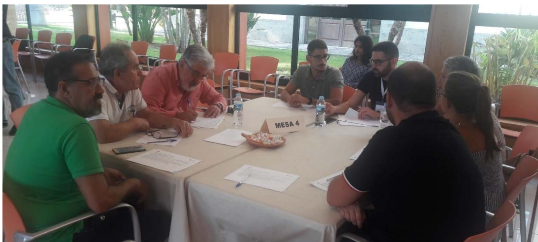
Figura 9. Componentes de la Mesa 4 (2ª jornada).

Tras la puesta en común de las diferentes opiniones de los participantes, por parte de este grupo se seleccionan las acciones siguientes como las de más alta prioridad para implantar en el municipio: