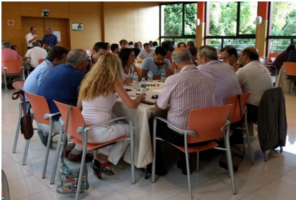
Figura 3. Componentes de la Mesa 2 (1ª jornada).

El Ayuntamiento de Agüimes decide incluir en el PACES 14 acciones específicas dedicadas al sector industrial, ya que en este municipio la Zona Industrial de Arinaga es un gran consumidor energético y, por ende, emisor de gases contaminantes, por lo que necesita una atención especial.