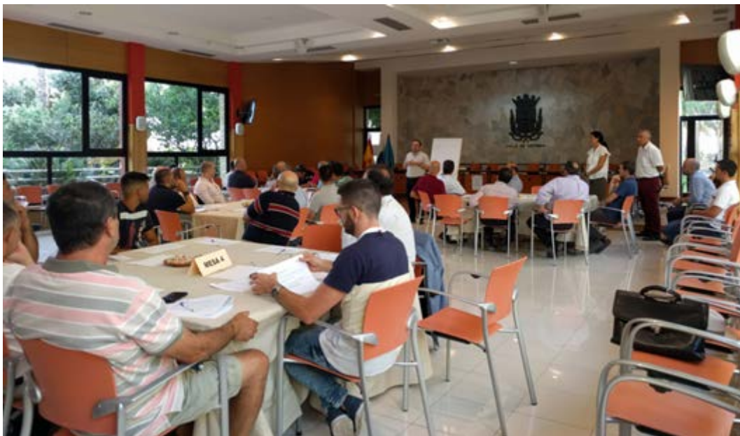
Figura 1. Apertura del acto de la 1ª jornada de participación ciudadana en el municipio de Agüimes.