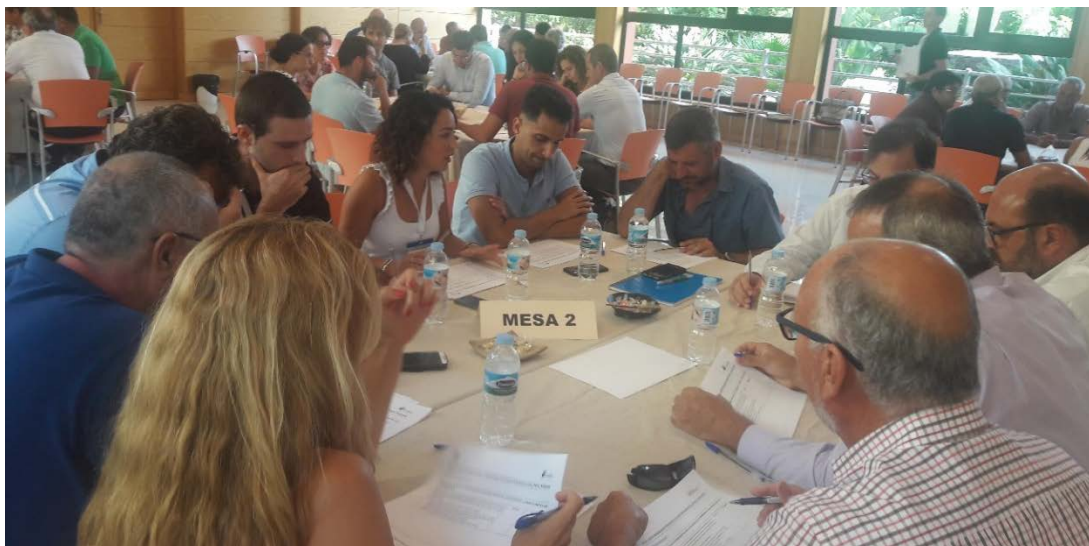
Figura 7. Componentes de la Mesa 2 (2ª jornada).

El Ayuntamiento de Agüimes decide incluir en el PACES 14 acciones específicas dedicadas al sector industrial, ya que en este municipio la Zona Industrial de Arinaga es un gran consumidor energético y, por ende, emisor de gases contaminantes, por lo que necesita una atención especial.