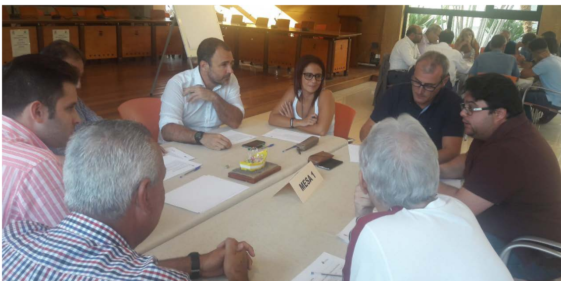
Figura 6. Componentes de la Mesa 1 (2ª jornada).

Esta mesa sectorial se encarga de debatir la necesidad de establecer en el municipio 23 acciones de implantación de medidas de ahorro y eficiencia en los edificios e instalaciones municipales, de alumbrado público y de impulsar el ahorro en el ciclo del agua, y su priorización.