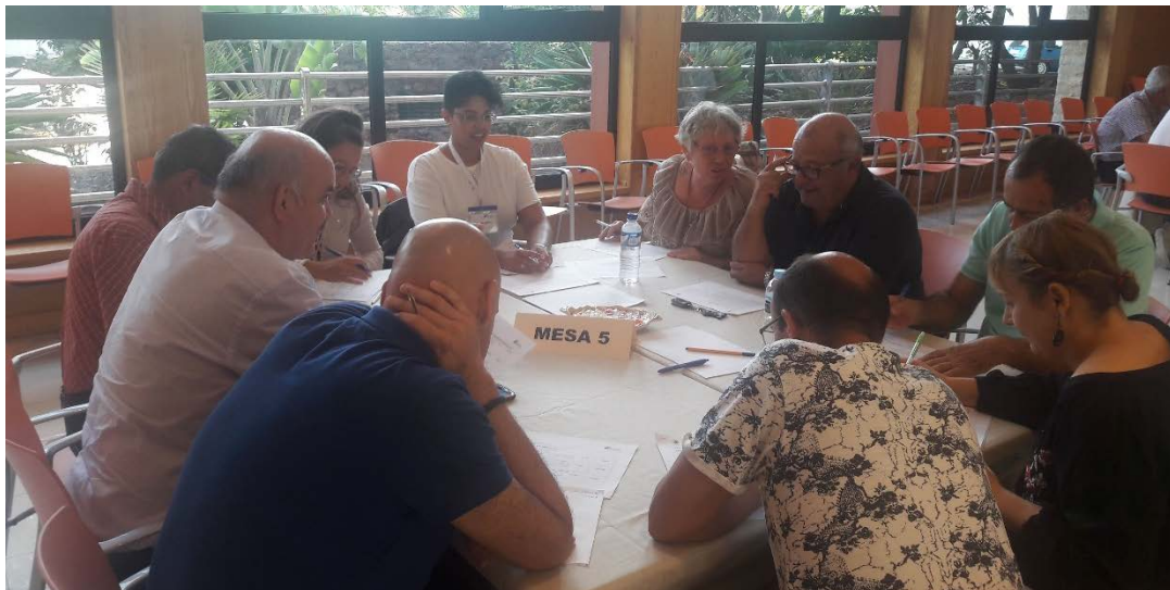
Figura 10. Componentes de la Mesa 5 (2ª jornada).

Una vez finalizado el trabajo por parte de los componentes esta mesa, se seleccionan las acciones siguientes como las de más alta prioridad para implantar en el municipio: