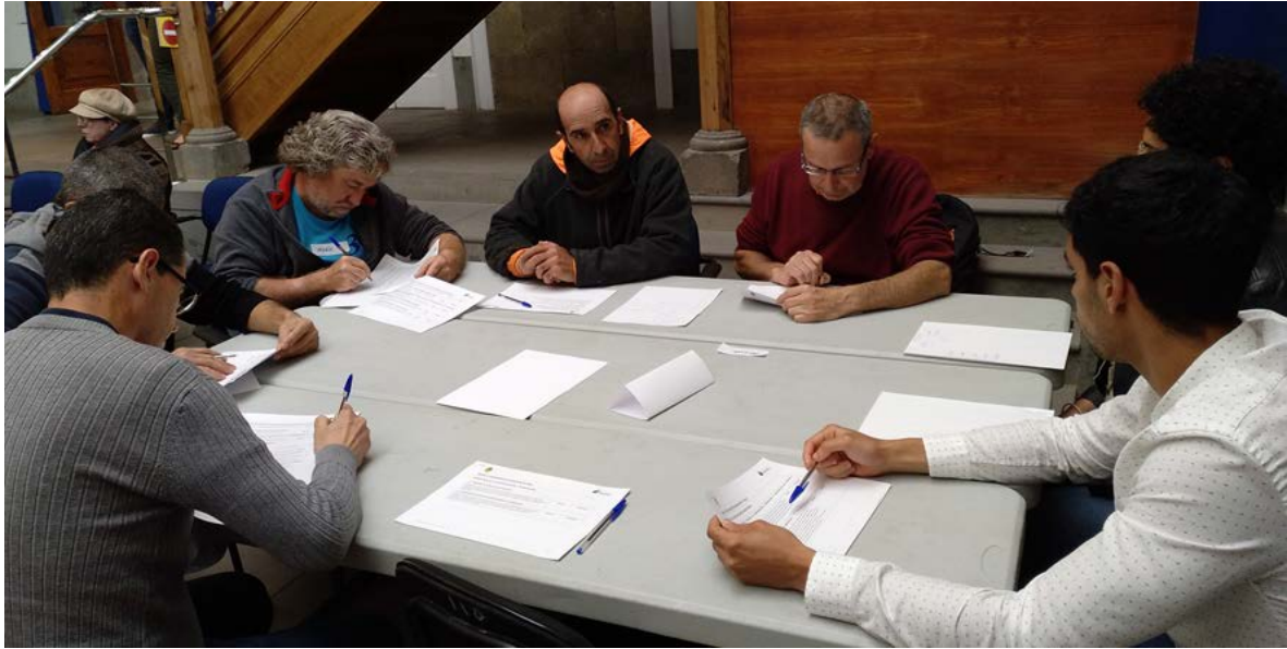
Figura 7. Componentes de la Mesa 5.