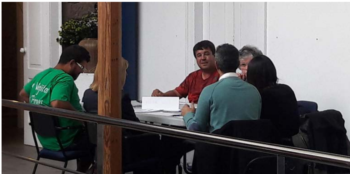
Figura 4. Componentes de la Mesa 2.