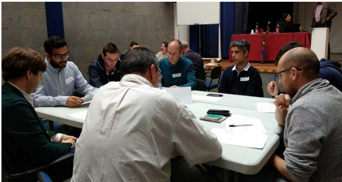
Figura 5. Componentes de la Mesa 3.