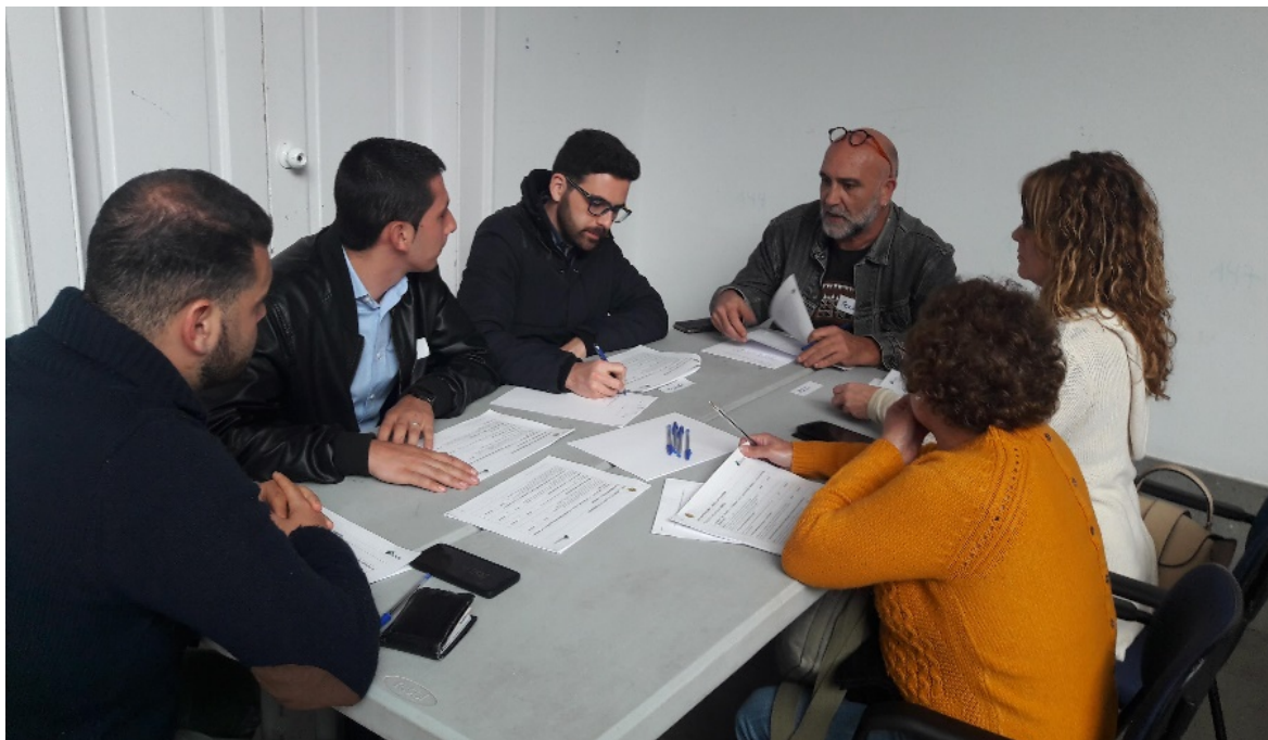
Figura 6. Componentes de la Mesa 4.