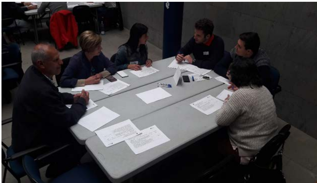
Figura 3. Componentes de la Mesa 1.