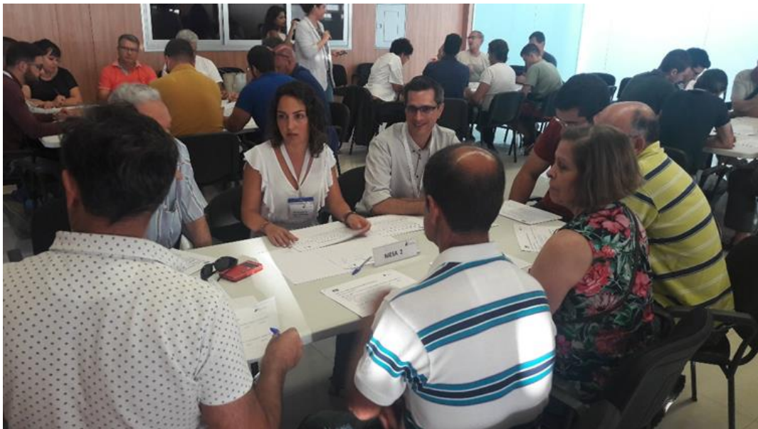
Figura 4. Componentes de la Mesa 2.

Una vez finalizada la tarea, por parte de los participantes de esta mesa se seleccionan las acciones siguientes como las de más alta prioridad para implantar en el municipio: