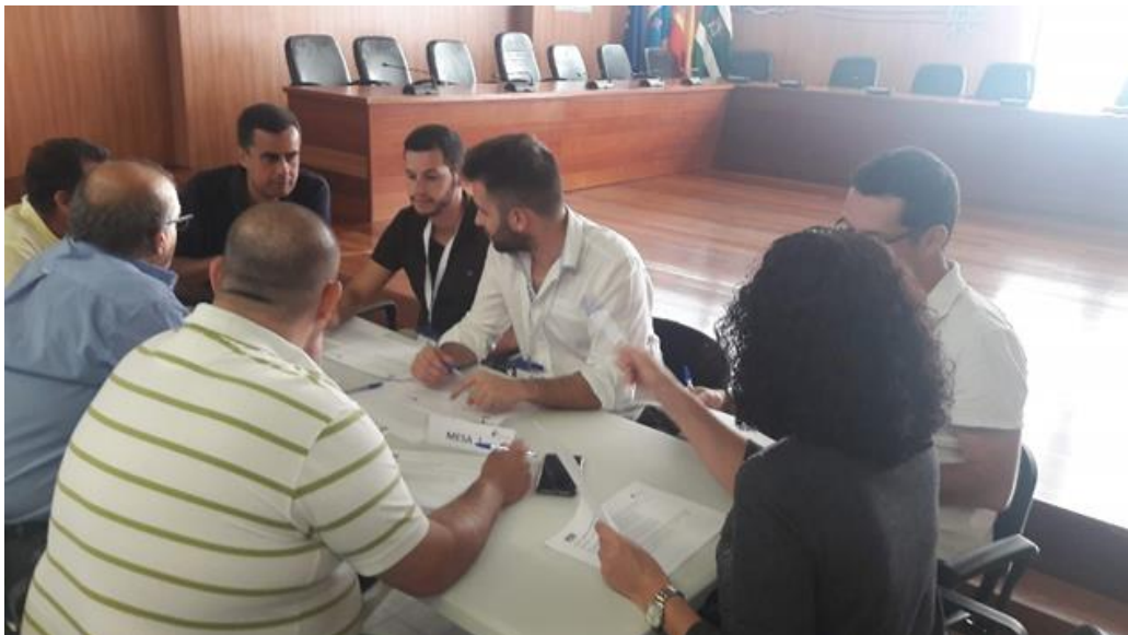
Figura 3. Componentes de la Mesa 1.

Tras la puesta en común de las diferentes opiniones de los participantes, por parte de este grupo se seleccionan las acciones siguientes como las de más alta prioridad para implantar en el municipio: