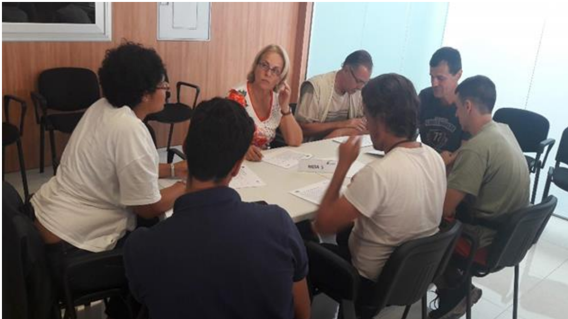
Figura 1: Componentes de la Mesa 5

Una vez finalizado su trabajo por parte de los componentes esta mesa, se seleccionan las acciones siguientes como las de más alta prioridad para implantar en el municipio: