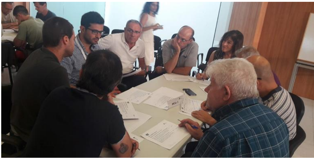
Figura 5. Componentes de la Mesa 3.

Finalmente los componentes de esta mesa seleccionan las acciones siguientes como las de más alta prioridad para implantar en el municipio: