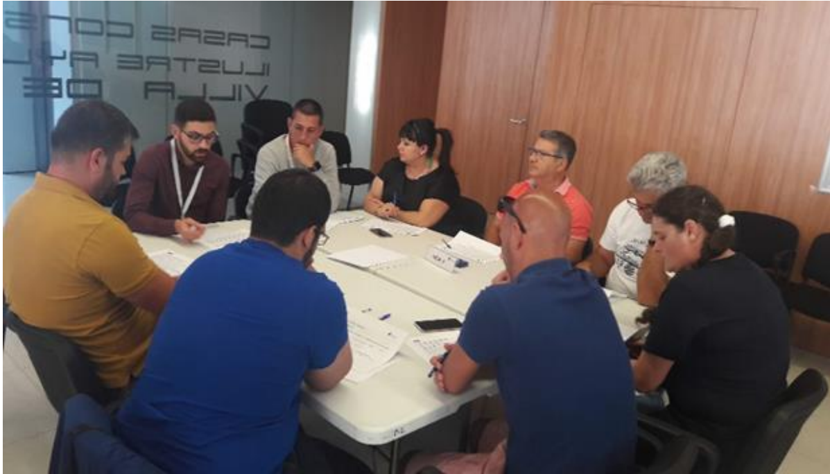
Figura 6. Componentes de la Mesa 4.

Tras la puesta en común de las diferentes opiniones de los participantes, por parte de este grupo se seleccionan las acciones siguientes como las de más alta prioridad para implantar en el municipio: