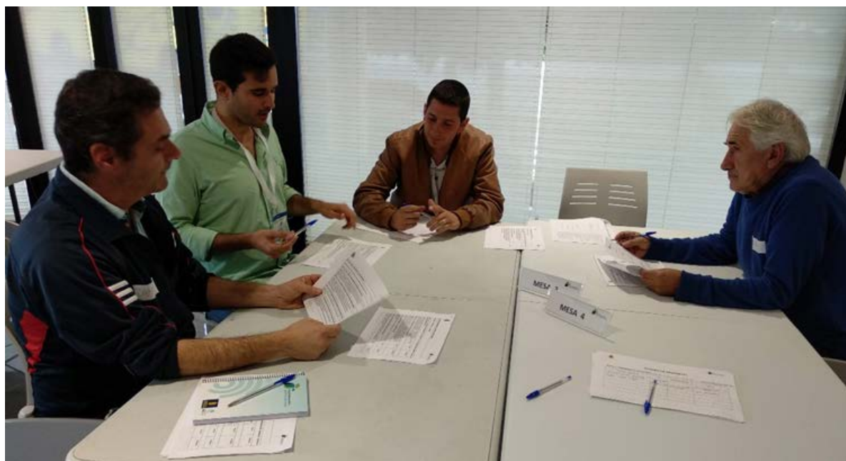
Figura 5. Componentes de la Mesa 3.

Por otro lado, en lo referente a la Promoción y gestión de la energía, se decide priorizar las siguientes acciones: