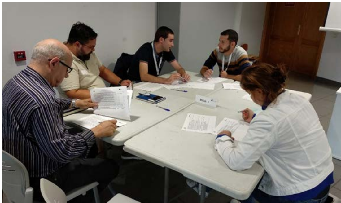
Figura 3. Componentes de la Mesa 1.