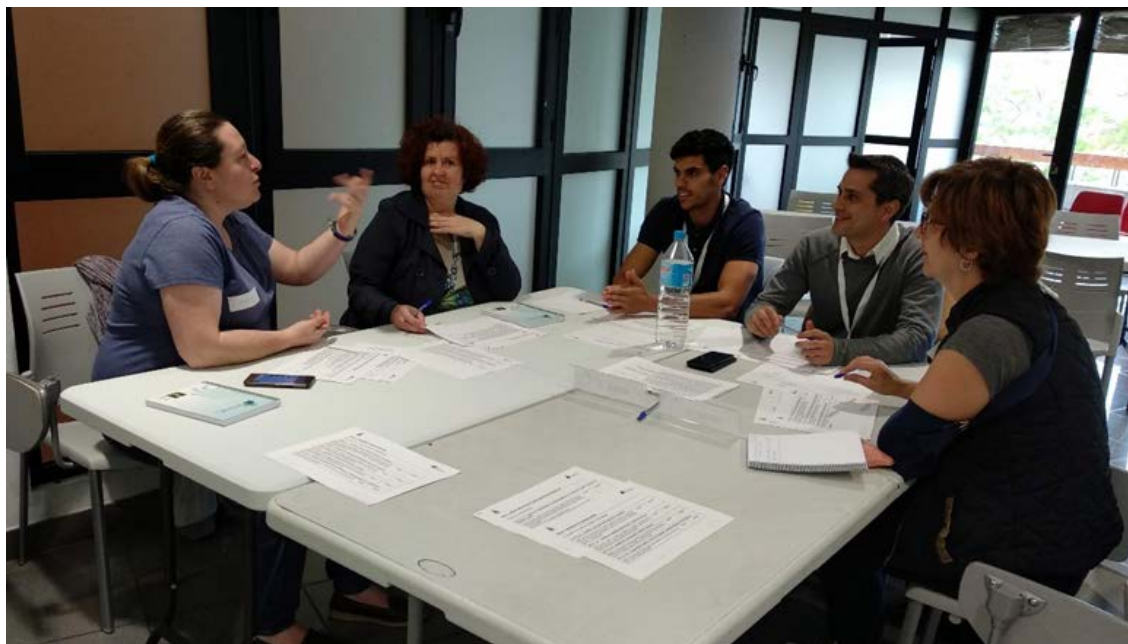
Figura 4. Componentes de la Mesa 2.