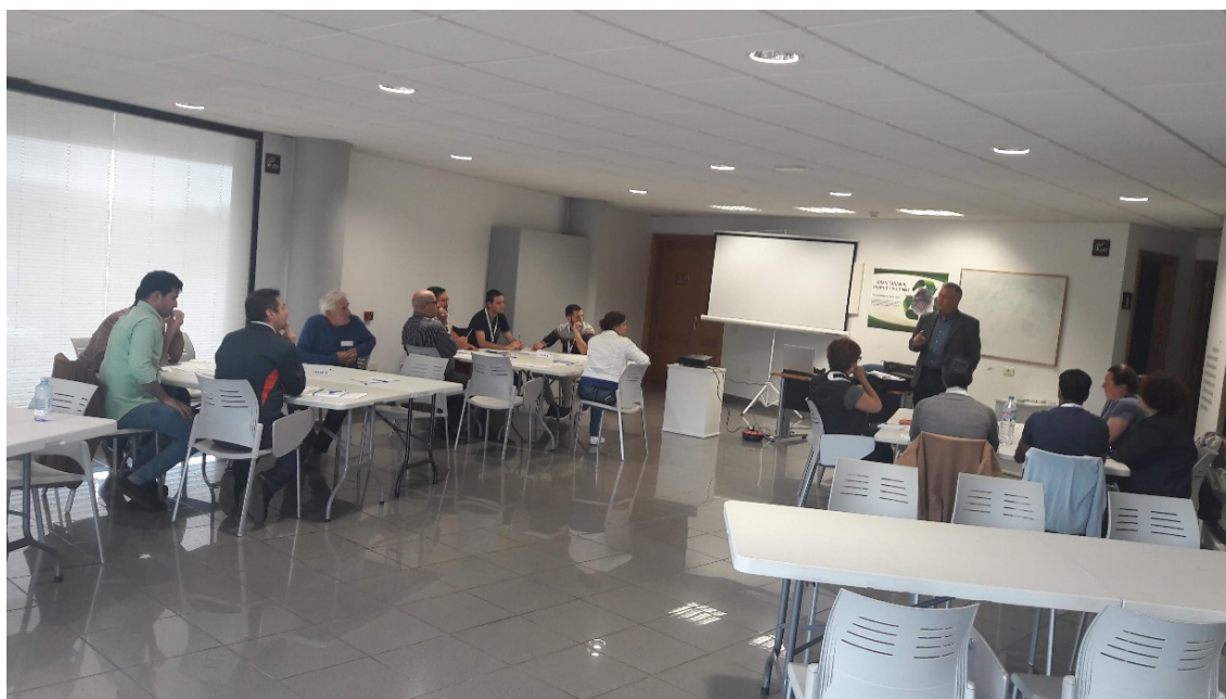
Figura 1. Apertura del acto de participación ciudadana en el municipio de Moya.