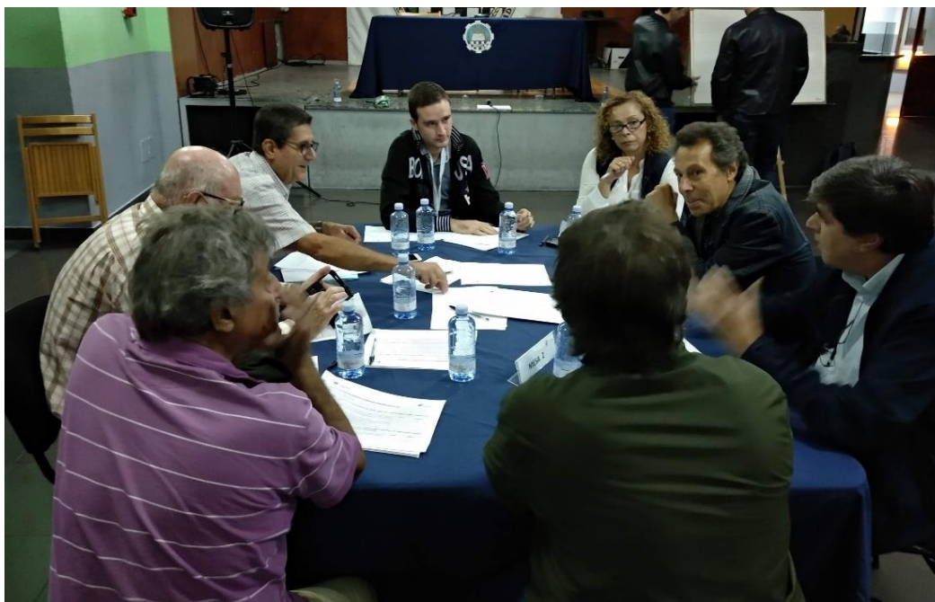
Figura 4. Componentes de la Mesa 2.