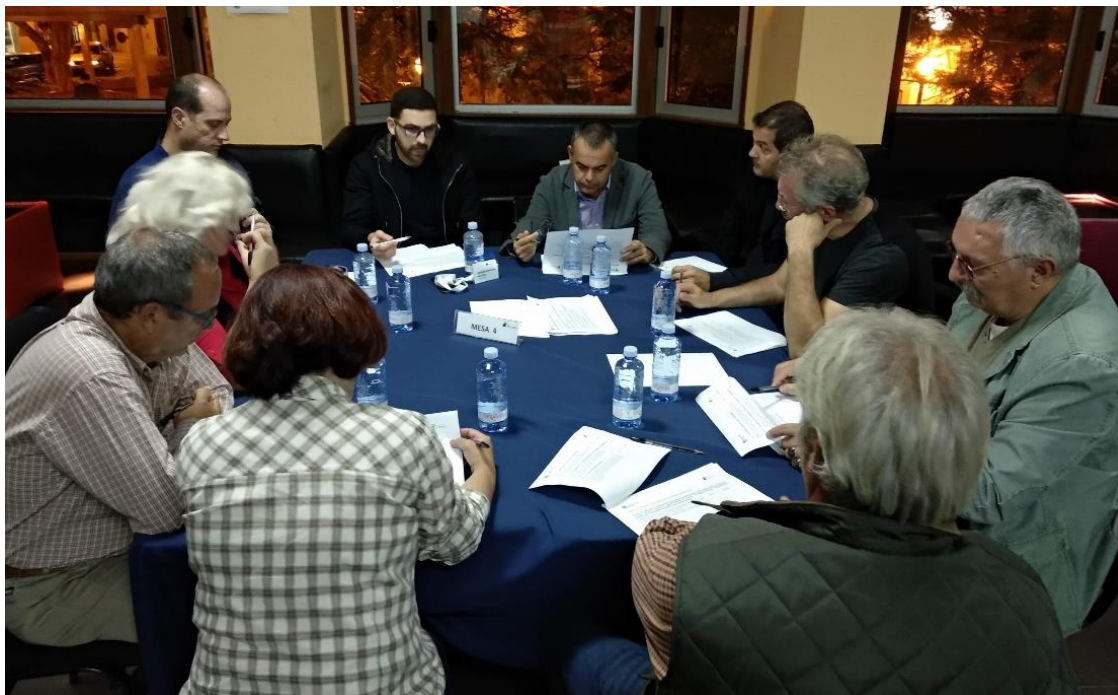
Figura 6. Componentes de la Mesa 4.