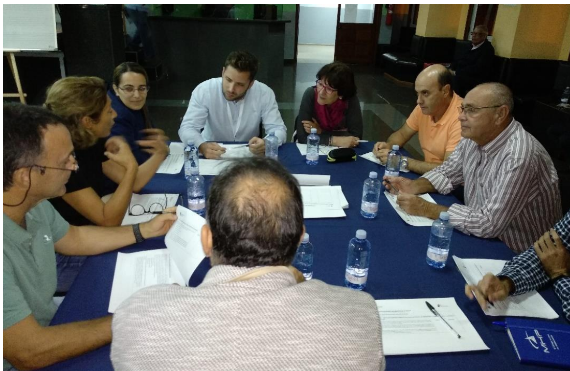
Figura 3. Componentes de la Mesa 1.