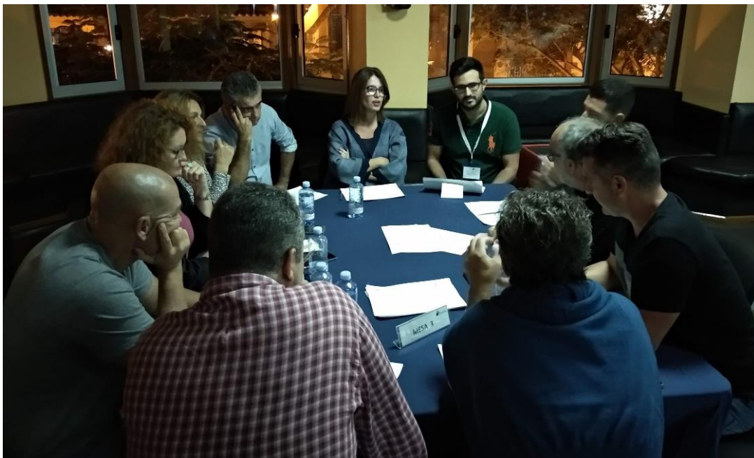
Figura 5. Componentes de la Mesa 3.