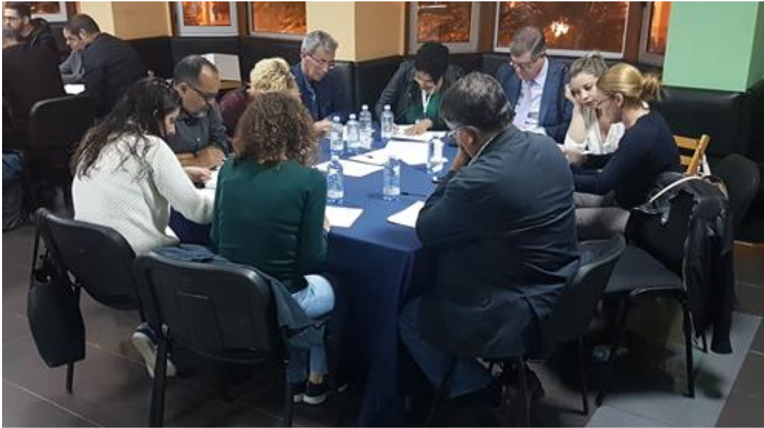
Figura 1: Componentes de la Mesa 5.