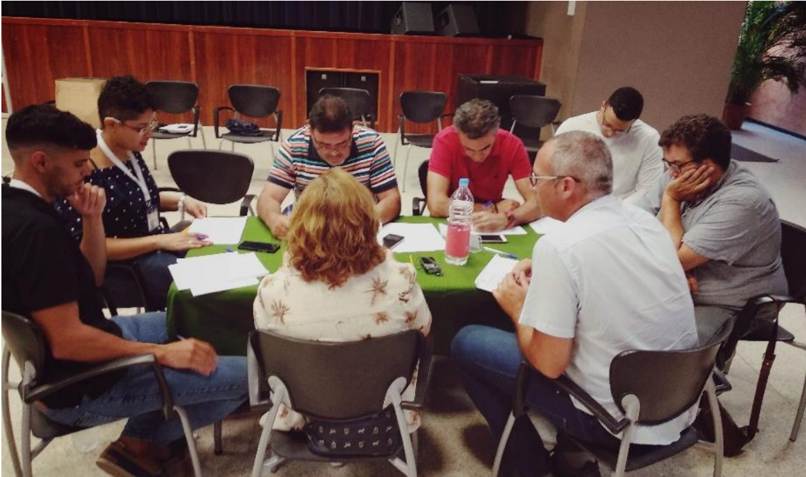
Figura 1: Componentes de la Mesa 5

Una vez finalizado el trabajo por parte de los componentes esta mesa, se seleccionan las acciones siguientes como las de más alta prioridad para implantar en el municipio: