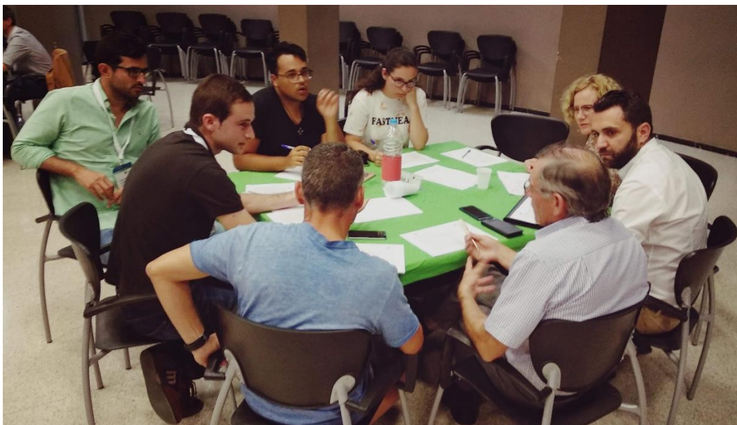
Figura 5. Componentes de la Mesa 3.

Finalmente los componentes de esta mesa seleccionan las acciones siguientes como las de más alta prioridad para implantar en el municipio: