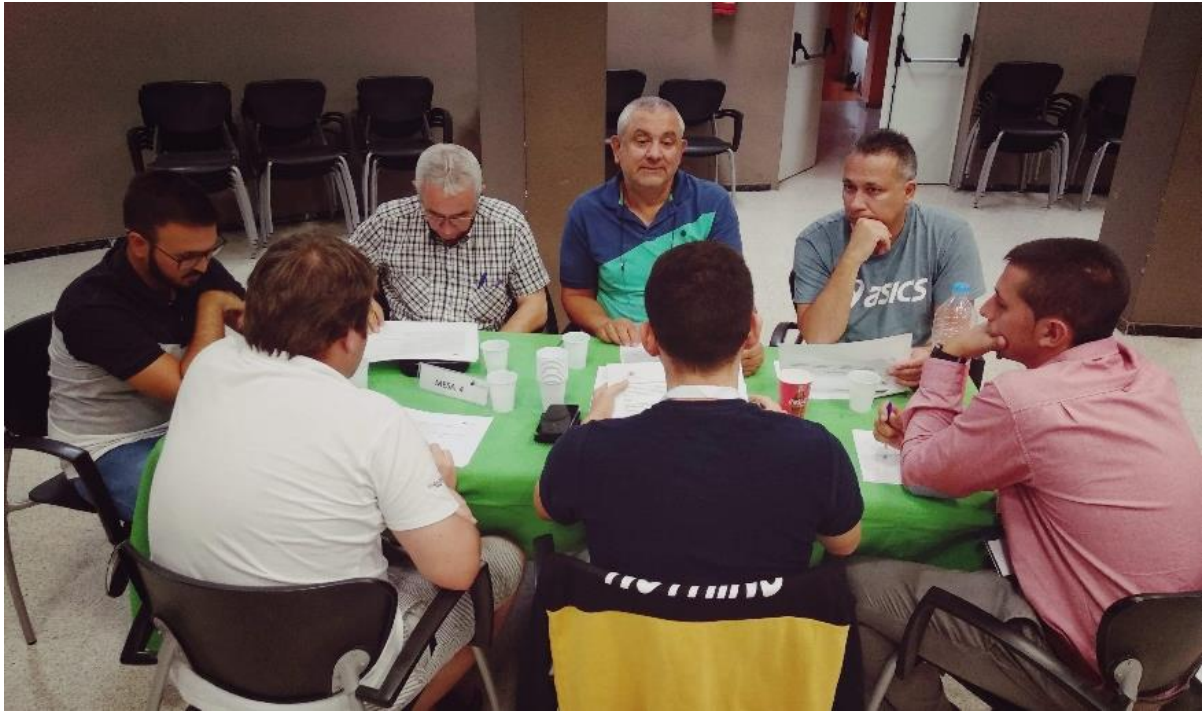
Figura 6. Componentes de la Mesa 4.

Tras la puesta en común de las diferentes opiniones de los participantes, por parte de este grupo se seleccionan las acciones siguientes como las de más alta prioridad para implantar en el municipio: