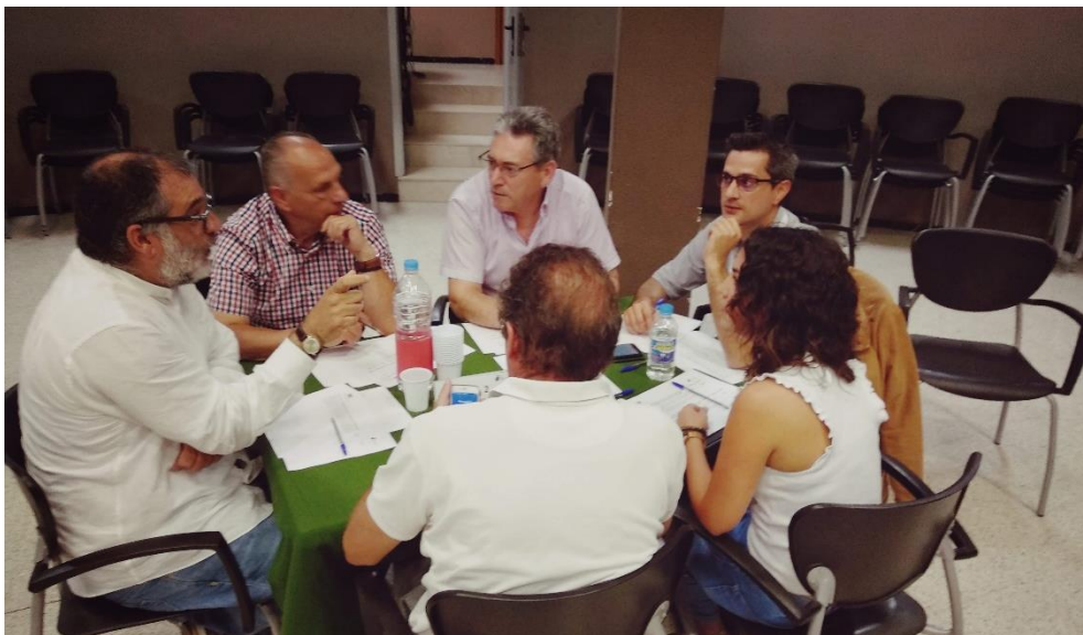
Figura 4. Componentes de la Mesa 2.

Una vez finalizada la tarea, por parte de los participantes de esta mesa se seleccionan las acciones siguientes como las de más alta prioridad para implantar en el municipio: