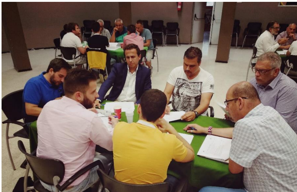
Figura 3. Componentes de la Mesa 1.

Tras la puesta en común de las diferentes opiniones de los participantes, por parte de este grupo se seleccionan las acciones siguientes como las de más alta prioridad para implantar en el municipio: